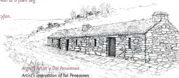
Argraff Artist o Dai Penannen Artist's impression of Tai Penannen